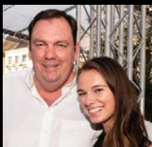
Pascal Vossius Cosmocafé

“ New York blijft een betoverende bestemming, of je er nu voor de 1e of de 15e keer bent. New York kent gewoon zijn gelijke niet: een werkelijk uniek bruisende plek op onze aardbol.